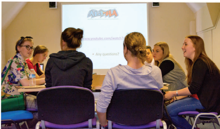
Cyfarfod ALPHA ar waith

Mae grŵp DECIPHer o bobl ifanc sy'n cynghori ynghylch ymchwil, sef ALPHA, yn grŵp o bobl ifanc 14-21 oed sydd ag ystod o brofiadau a safbwyntiau, er mwyn helpu i sicrhau bod gwaith ymchwil yn adlewyrchu'r hyn sy'n berthnasol, yn bwysig ac yn dderbyniol i bobl ifanc.